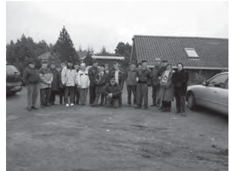
Kl. 10 mødte vi 21 deltagere, for de flestes vedkommende, efter at have kørt over 100 km.

Tirsdage d. 20. februar var afdelingen af Kurt Thomsen inviteret til at besøge ham i hans dejlige store sommerhus i ferielandet Vejrs.