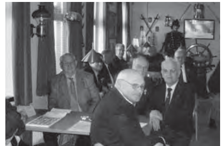
Der lyttes opmærksomt til formandens vise ord

Begrundelsen herfor var, at vi nu har medlemmerne af den ophørte Lolland-Falster afdeling med i Syd-Østsjællands afdeling.