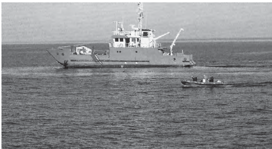
Miljøfartøjet METTE MILJØ på arbejde

Med mere end 4300 havmiljø vogtere ved årsskiftet er konklusionen, at kampag-