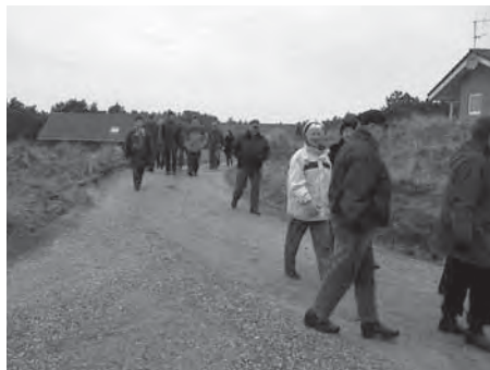
Fra stranden gik vi op gennem en næsten mennesketom Vejrs sommerby

Historier og minder om oplevelser fra vores tid på forterne blev fortalt, og jeg tør godt sige, at de bliver ikke ringere for hver gang de bliver fortalt.