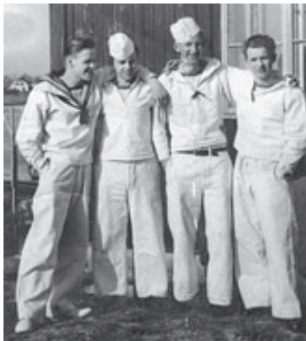
Her står vi fire basser fra stambesætningen. Jeg selv på højre fløj (m. blå krave)

Efter eksercérskolen (rekruttiden) blev jeg taget til stambesætningen. Jeg blev "Hovmester" i officersmessen. Det gav 50 øre mere om dagen - og rigtig "Guffekost"; det var jo mig der lavede kostplanen for, hvad officererne skulle have at spise. Denne tjans var hidtil blevet besat af udlærte tjenere, men jeg hørte, de var blevet "for dygtige". Hvad dygtigheden bestod af, fandt jeg hurtigt ud af, idet de handlende i Dragør, hvor jeg købte ind, først spurgte mig om, hvor meget der skulle lægges på regningen til mig selv, så det holdt jeg mig klogeligt fra.