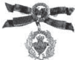
40 års jubilæumstegnet