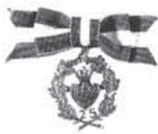
25 års jubilæumstegnet