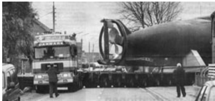
Den første større forhindring, svinget mellem Østergade og Færgevej, blev passeret langsomt, men uden problemer

I modsætning til ”Springeren”, skal ”Askø” under tag. Der bygges de kommende måneder en hal udenom det bassin, som den nu ligger i. Bassinet skal fyldes med saltvand for at holde skroget fugtigt. I modsat fald er der risiko for, at det