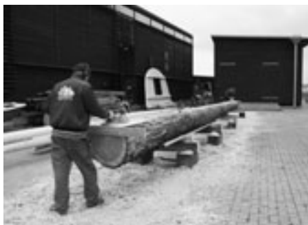
Den nye mast forarbejdes Brørup

EBELTOFT: Et meget smukt og stort grantræ er fældet i en skov ved Silkeborg. Og godt 50 meter måler den nu nedlagte gigant, en statelig Douglas Pine, der skal ende som mast med fire ræer på verdens største træskib, Fregatten Jylland , i Ebeltoft.