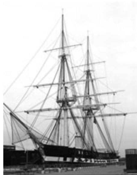
Den gamle fregat med kun 2 master

' - Vi har udført mange specialopgaver og for eksempel lavet en flagstang på 45 meter til Brøndby Stadion, så vi finder det helt naturligt at påtage os opgaven'. Ifølge Viggo Momsen har træet stået et