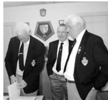
Der blev kigget meget i de gamle protokoller