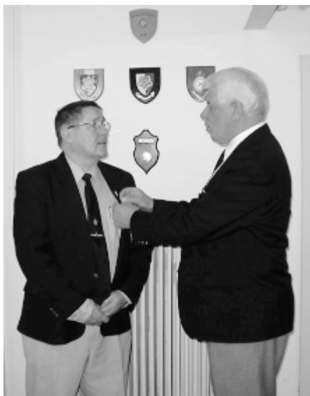
Præsidenten påhæfter Kystartilleriforeningens hæderskors

Formanden bød alle hjertelig velkommen og en særlig velkomst til vore gæster. I velkomsten blev lidt af afdelingens historie genopfrisket og den gamle fane, der blev indviet 2. september samme år som afdelingens stiftelse, var ophængt og præsenteret sammen med fanen fra den nu nedlagte Østsjællands afdeling . Vi kunne også mindes, at man i 1917 kunne afslutte et arrangement efter faneindvielsen på Ruin-terrænet i Vordingborg