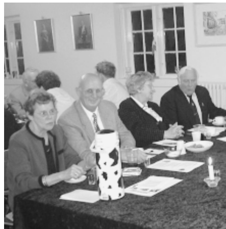
God stemning ved bordene