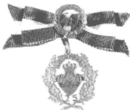
40 års Jubilæumstegnet