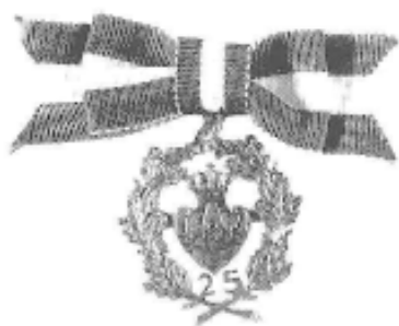
25 års Jubilæumstegnet