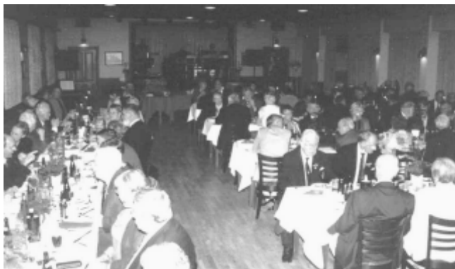
Et udsnit af det store selskab