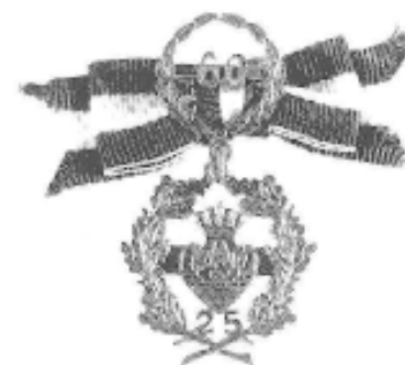
60 års Jubilæumstegnet