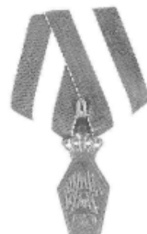
50 års Jubilæumstegnet